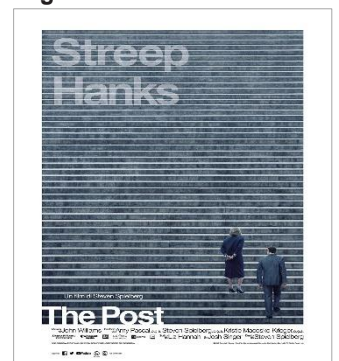
The Post VEN. 23 20.30 SAB. 24 20.30 DOM. 25 20.30