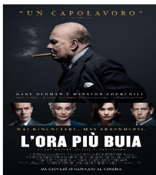
L'ora più buia VEN. 16 20.30 SAB. 17 20.30 DOM. 18 20.30