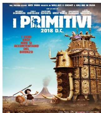
I primitivi SAB. 17 17.00 DOM. 18 15.00 17.00