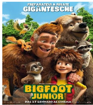
Bigfoot Junior SAB. 03 17.00 DOM. 04 15.00 17.00