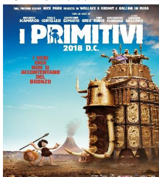
I primitivi SAB. 24 17.00 DOM. 25 15.00 17.00