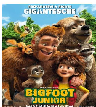
Bigfoot Junior SAB. 10 17.00 DOM. 11 15.00 17.00