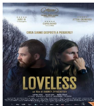
Loveless GIO. 22 20.30 Spazio d'essai Prezzo ridotto per tutti