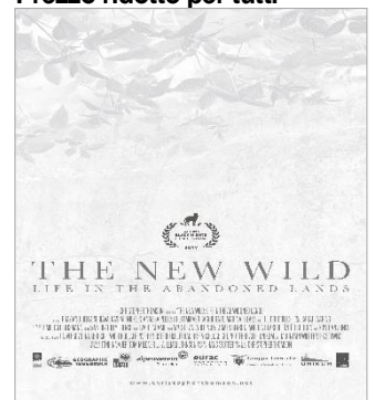
The New Wild GIO. 15 20.30 Presente in sala il regista, a seguire incontro/dibattito