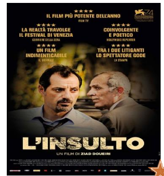
L'insulto GIO. 08 20.30 Spazio d'essai Prezzo ridotto per tutti