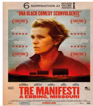
Tre manifesti a Ebbing, Missouri SAB. 03 20.30 DOM. 04 20.30