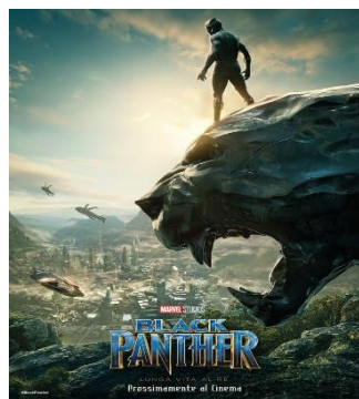
Black Panther VEN. 02 20.30 SAB. 03 20.30 DOM. 04 20.30