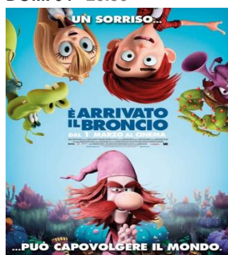
È arrivato il Broncio SAB. 10 15.00 DOM. 11 15.00