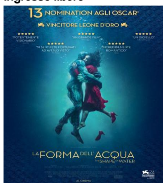
La Forma dell'Acqua VEN. 09 20.30 SAB. 10 17.00 20.30 DOM. 11 17.00 20.30