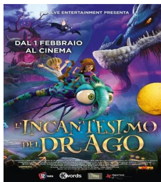
L'incantesimo del drago SAB. 03 17.00 DOM. 04 15.00 17.00