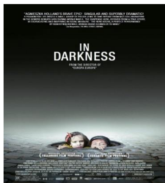
In Darkness GIO. 01 20.30 Cineforum di Quaresima Ingresso libero