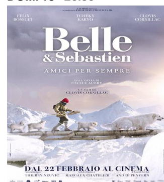
Belle & Sebastien 3 SAB. 24 17.00 DOM. 25 15.00 17.00