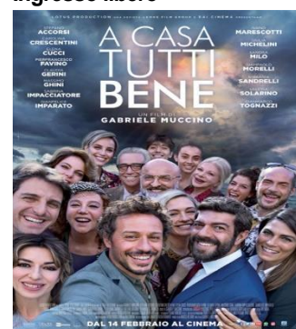
A casa tutti bene VEN. 16 20.30 SAB. 17 20.30 DOM. 18 20.30