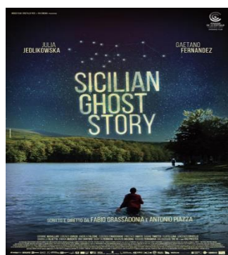
Sicilian Ghost Story GIO. 22 20.30 Giornata della Memoria e dell'Impegno - Ingresso ridotto