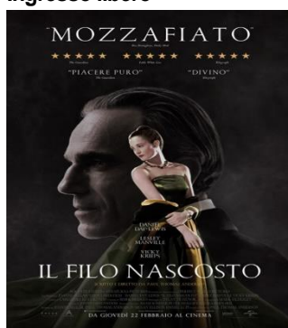
Il filo nascosto VEN. 23 20.30 SAB. 24 20.30 DOM. 25 20.30