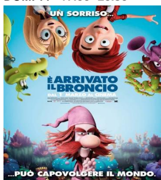
È arrivato il Broncio SAB. 17 17.00 DOM. 18 15.00 17.00