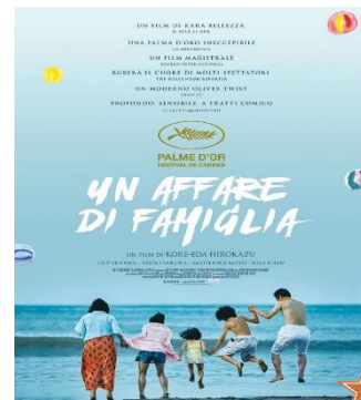
Un affare di famiglia GIO. 10 20.30 Spazio d'essai Ingresso ridotto