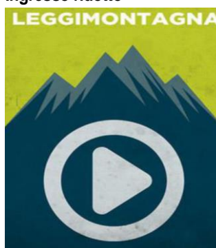
Al Cinema con Leggimontagna VEN. 25 20.30 A seguire dibattito Ingresso libero