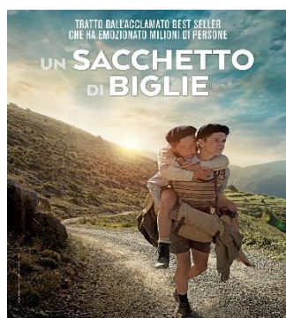
Un sacchetto di biglie GIO. 24 20.30 Giorno della Memoria Ingresso ridotto