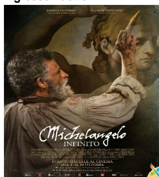
Michelangelo - Infinito GIO. 31 20.30 L'arte in sala Ingresso ridotto