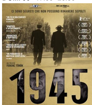
1945 GIO. 17 20.30 Uno sguardo nell'anima Ingresso ridotto