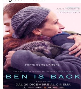
Ben Is Back VEN. 18 20.30 SAB. 19 20.30 DOM. 20 20.30