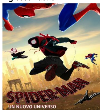
Spider-Man: Un nuovo universo SAB. 12 17.00 DOM. 13 15.00 17.15