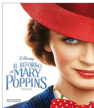
Il ritorno di Mary Poppins VEN. 04 17.00 20.30 SAB. 05 17.00 20.30 DOM. 06 17.00 20.30