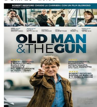
Old Man & the Gun SAB. 26 20.30 DOM. 27 20.30