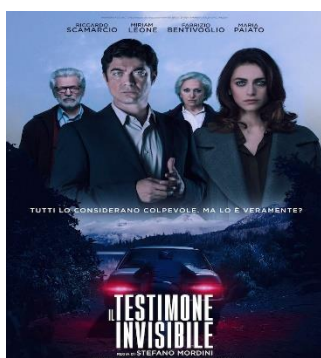
Il Testimone Invisibile VEN. 11 20.30 SAB. 12 20.30 DOM. 13 20.30