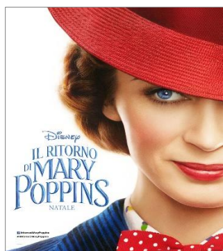
Il ritorno di Mary Poppins MAR. 01 17.00 20.30