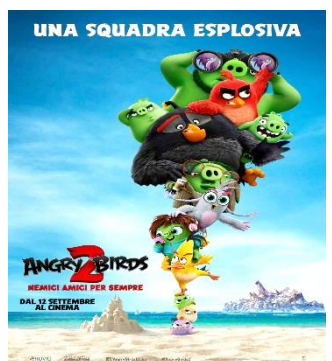
Angry Birds 2 SAB. 28 17.15 DOM. 29 15.00 17.15