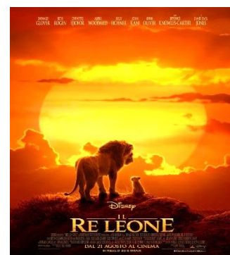
Il Re Leone SAB. 07 17.15 DOM. 08 15.00 17.15