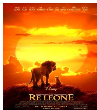
Il Re Leone SAB. 14 17.15 DOM. 15 15.00 17.15