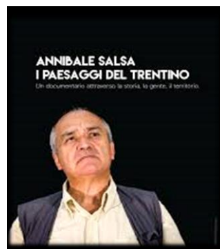
I paesaggi del Trentino LUN. 23 20.30 ASCA - Cortomontagna Ingresso libero