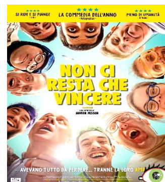
Non ci resta che vincere GIO. 19 20.30 Sguardi Diversi Ingresso ridotto