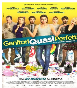
Genitori quasi perfetti VEN. 06 20.30 SAB. 07 20.30 DOM. 08 20.30