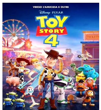
Toy Story 4 SAB. 21 17.15 DOM. 22 15.00 17.15