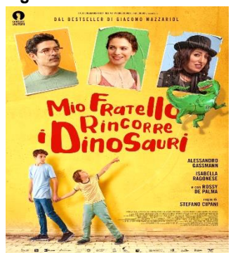
Mio fratello rincorre i dinosauri VEN. 13 20.15 SAB. 14 20.30 DOM. 15 20.30