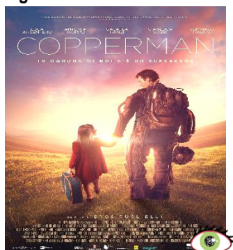
Copperman GIO. 12 20.30 Sguardi Diversi Ingresso ridotto