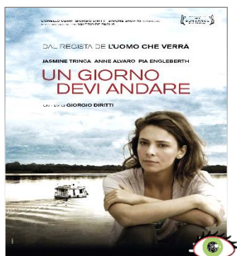
Un giorno devi andare DOM. 01 20.30 Sguardi Diversi Ingresso ridotto