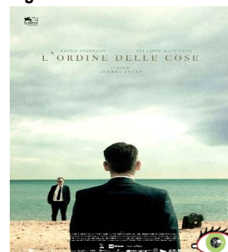
L'ordine delle cose GIO. 26 20.30 Sguardi Diversi Ingresso ridotto