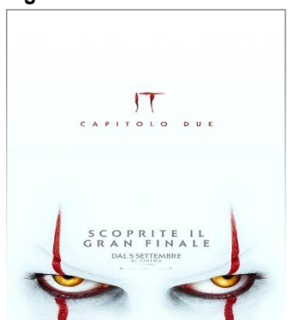
IT: Capitolo 2 VEN. 20 20.30 SAB. 21 20.30 DOM. 22 20.30