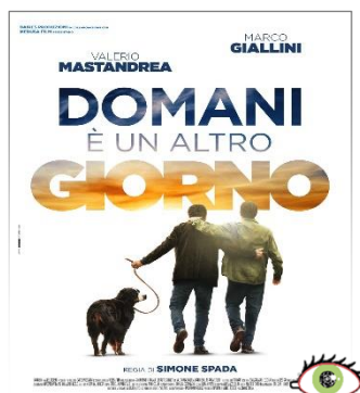
Domani è un altro giorno GIO. 05 20.30 Sguardi Diversi Ingresso ridotto